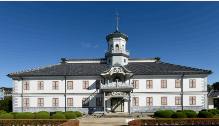
국보 구 카이치 학교 건물