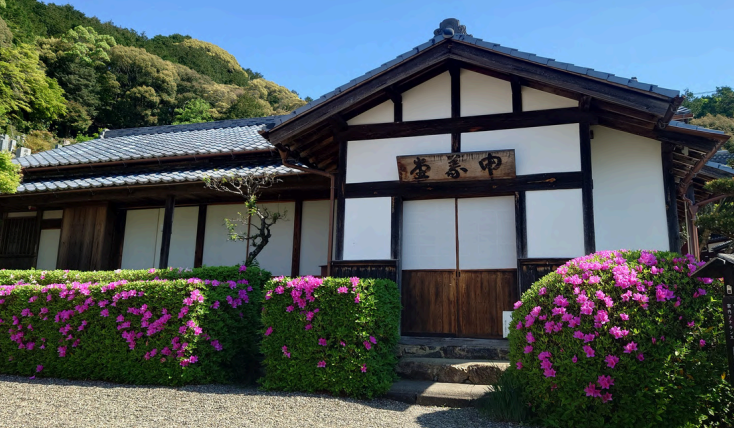
목조 / 건축 면적 105㎡ 기와지붕 / 단층 집