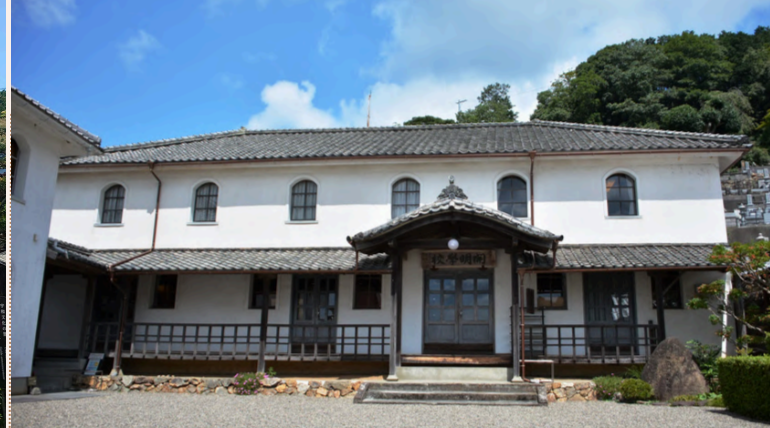
목조 / 건축 면적 169.4㎡ 2층 건물 / 건물구조 / 기와 지붕