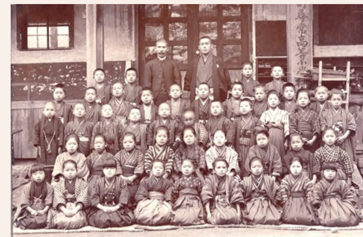
메이지 37년 일반과 졸업생