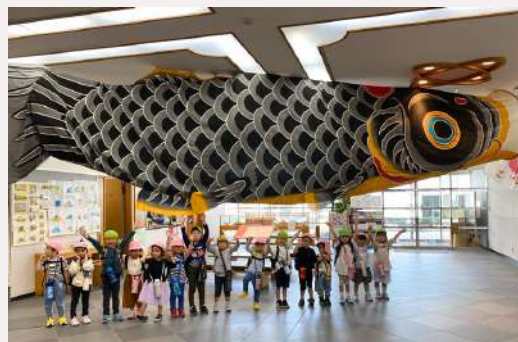
시민 갤러리 (1F) citizen gallery