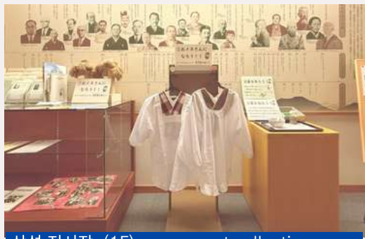
상설 전시장 (1F) permanent collection room