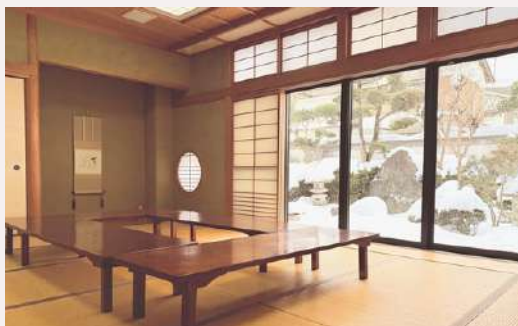
일본식 다다미방 (1F) Japanese style room