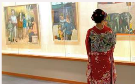
기획 전시장 (2F) special exhibition room