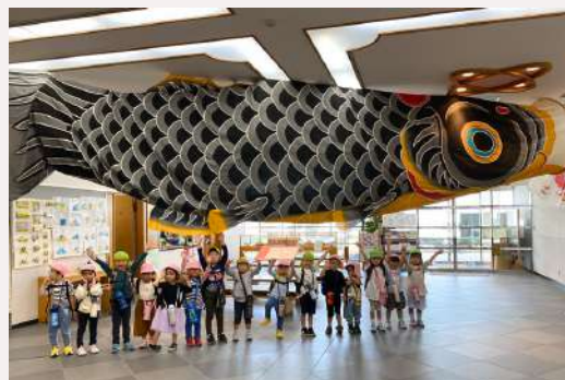
市民藝廊 (1F) citizen gallery