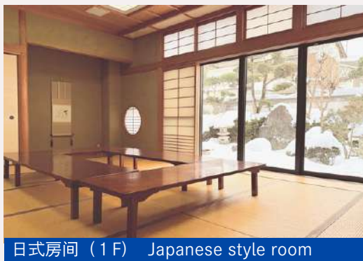
日式房间 (1F) Japanese style room