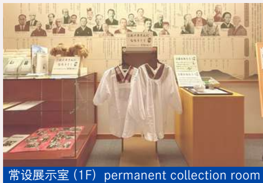
常设展示室 (1F) permanent collection room