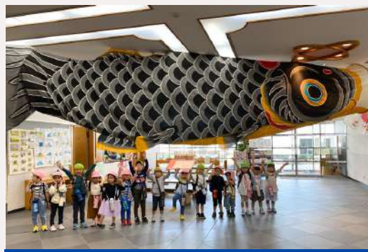
市民画廊 (1F) citizen gallery