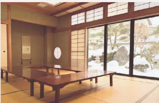
和室 (1F) Japanese style room