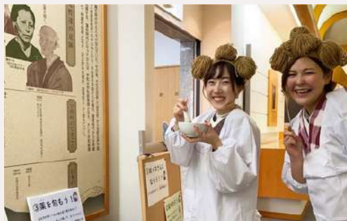
常設展示室 (1F) permanent collection room

宇和町のために尽力した人々を紹介。日本人初の女医、お伊ネさんになりきって、お薬をつくる体験もできます。