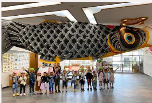
市民ギャラリー (1F) citizen gallery