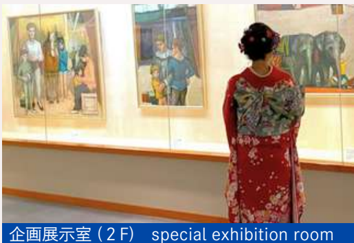
企画展示室 (2F) special exhibition room