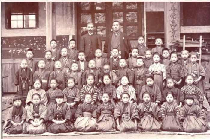
明治三十七年度 尋常科畢業生